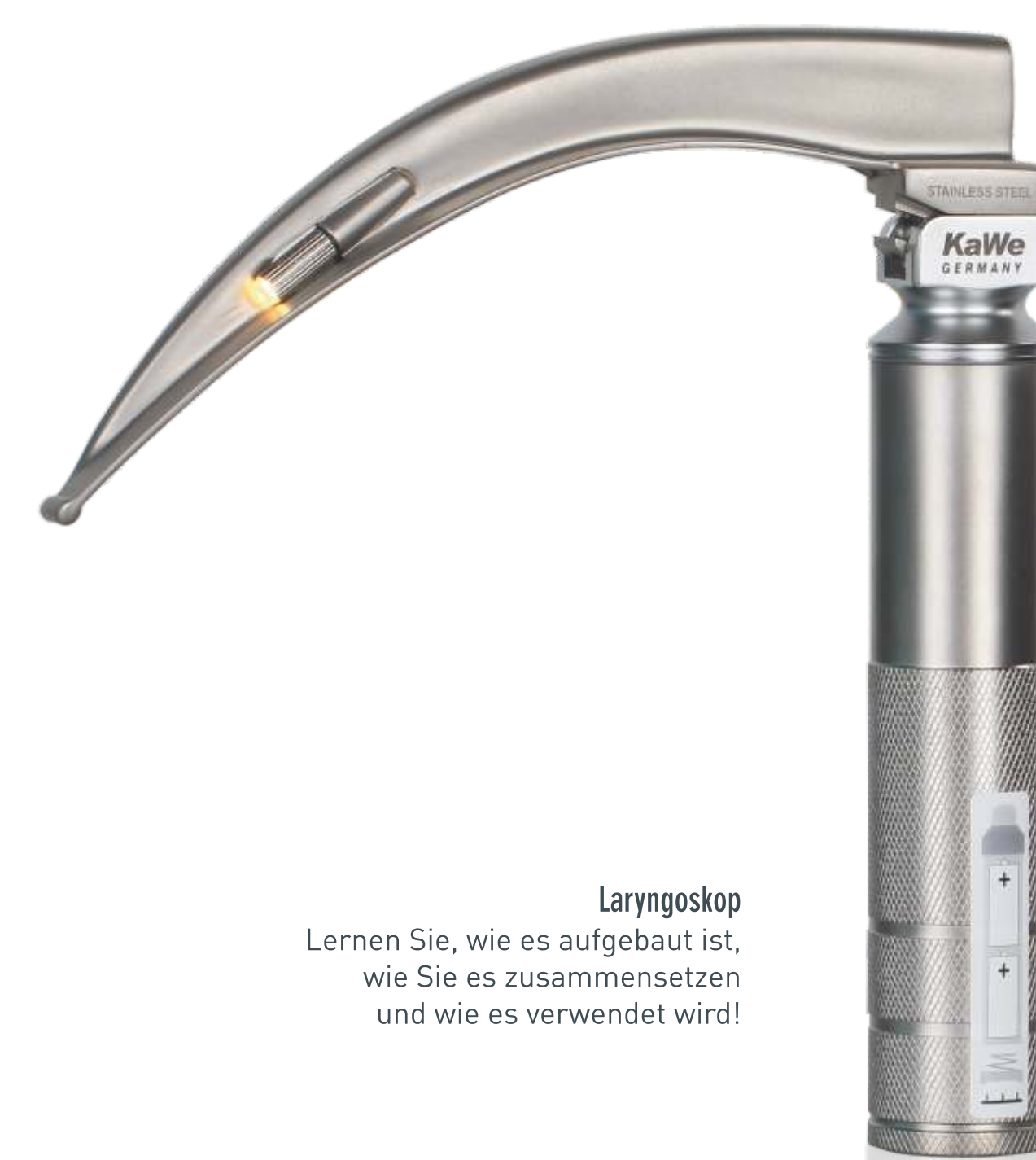
Laryngoskop Lernen Sie, wie es aufgebaut ist, wie Sie es zusammensetzen und wie es verwendet wird!