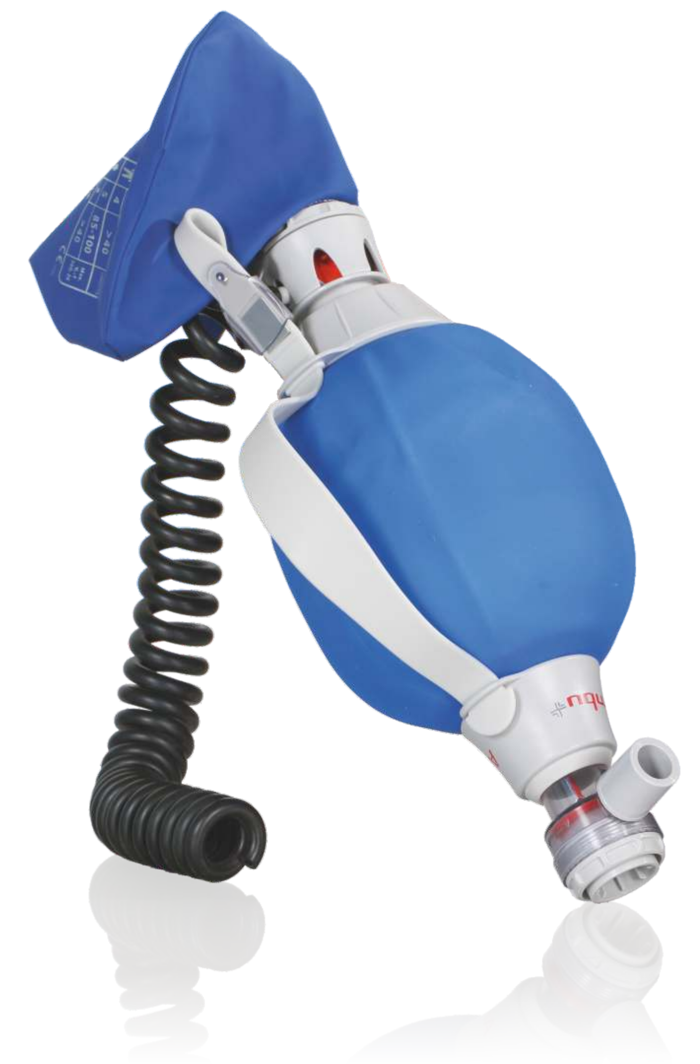
Ambu-Beutel Erhalten Sie Antwort auf die Frage, wie Sie ihn richtig verwenden und welchen Vorteil ein Reservoir-Beutel bringt!