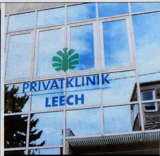
Toller Erfolg: der Tag der offenen Tür in der Privatlinik Leech