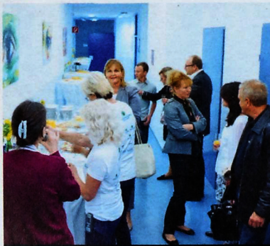
Bei einem Buffet konnten sich die Gäste von der neuen Tagesklinik überzeugen.